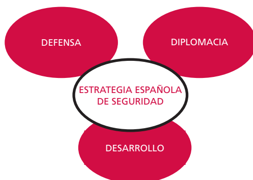
Gráfico 1. Diagrama de Venn